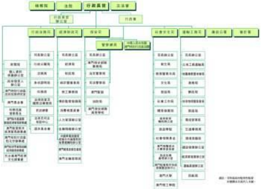
图1-1澳门特别行政区组织图

澳门的行政机关包括政府总部及各部门。政府总部辖行政法务司、经济财政司、保安司、社会文化司和运输工务司。5个司及其相关下属部门负责执行法例和政策，为市民提供直接服务。特区政府架构如下图：