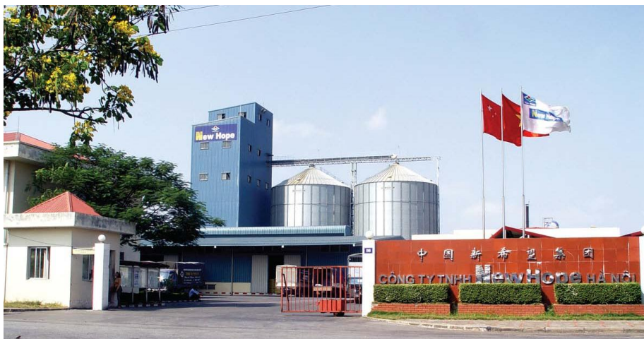
河内新希望集团有限公司

目前，中方承建的部分大型项目陆续建成投产。其中，锦普热电厂一、二期项目已于2011年9月正式移交越方；金瓯化肥厂已于2012年1月30日建成投产；宁平煤头化肥厂已于2012年3月30日建成投产；新莱氧化铝厂于2012年12月建成投产。“三线一枢”和“荣市—胡志明市”通讯信号改造、河内轻轨二号线、永新二期火电厂等项目进展基本顺利。沿海三期火电厂已于2012年12月开工建设。