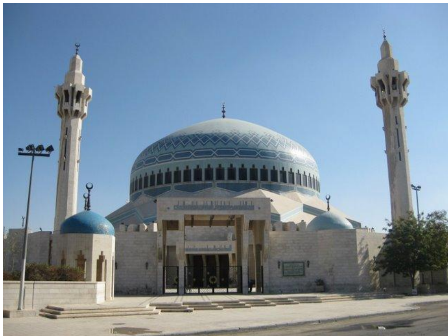
安曼阿卜杜拉国王清真寺

约旦全国共划分为12个省，分别是安曼省、伊尔比德省、马安省、扎尔卡省、拜勒加省、马弗拉克省、卡拉克省、塔菲拉省、马德巴省、杰拉什省、亚喀巴省、阿吉隆省。