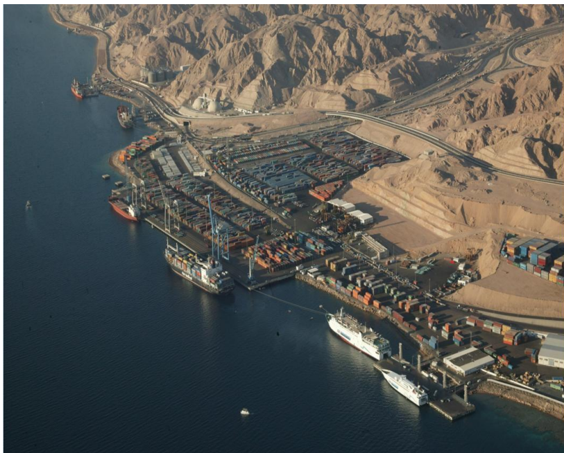
约旦亚喀巴集装箱港口

亚喀巴港是约旦唯一的出海口，也是进出口贸易集散中心，拥有集装箱码头和散装码头，设置22个深水泊位，固定航线29条，分别通往全世界除西非海岸及南美西部海岸的200多个港口，年货物吞吐量可达2200万吨。近岸处无障碍物，海床主要是沙和珊瑚。港口配套有酒店、医院、购物中心等设施。全年除开斋节和宰牲节外24小时无休。目前约旦尚无自己的船队。