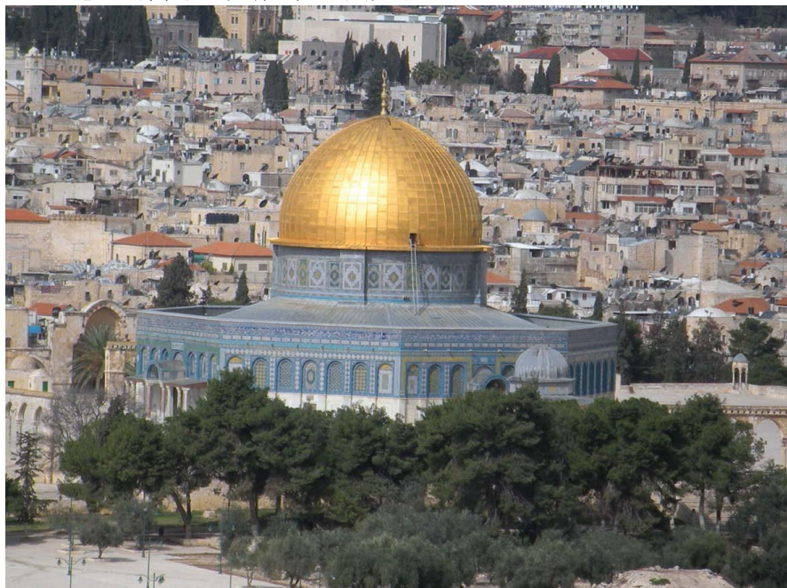
耶路撒冷——金顶清真寺