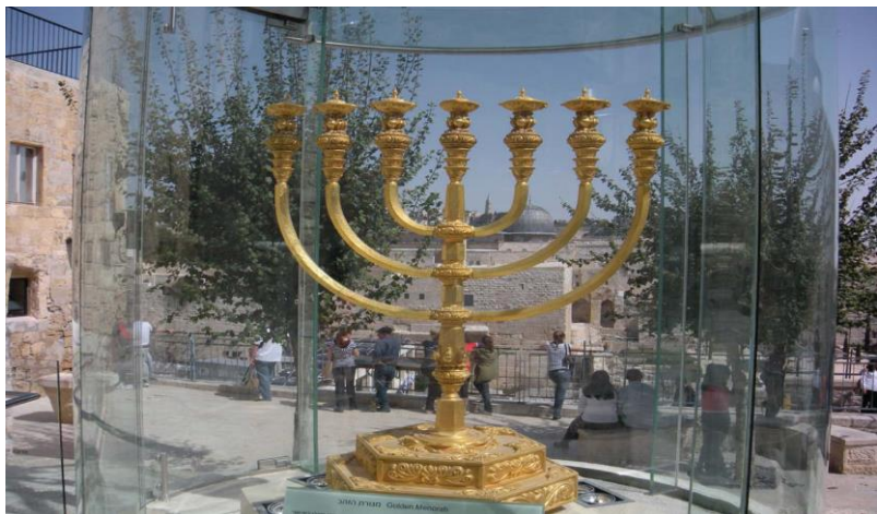
以色列国徽标志——七叉大烛台

以色列居民主要为犹太民族，约占总人口的75.4%，达601.5万，约占全世界犹太人的42%；阿拉伯人占人口总数的20.6%，约164.8万，另有约4%的人口为德鲁兹人、贝都因人和切尔克斯人。