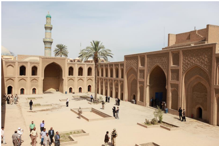
巴格达穆斯林西里亚大学

【教育】悠久的历史造就了伊拉克灿烂的文化。如今，伊拉克境内古迹遍布，底格里斯河沿岸的塞琉西亚、尼尼微、亚述等均是伊拉克著名的古城。位于巴格达西南90公里的幼发拉底河右岸的巴比伦是与古代中国、印度、埃及齐名的人类文明发祥地，盛传的“空中花园”被列为世界七大奇迹之一。已有1000多年历史的伊拉克首都巴格达更是其辉煌文化的缩影，早在公元8至13世纪，巴格达就成为西亚和阿拉伯世界的政治经济中心和文人学士荟萃之地。大学有巴格达、巴士拉、摩苏尔等大学。海湾战争后，伊拉克教育经费不足，师资严重匮乏，同时，由于人民生活困难，伊拉克适龄儿童和青年（6-23岁）入学率大幅下降，教育严重滑坡。