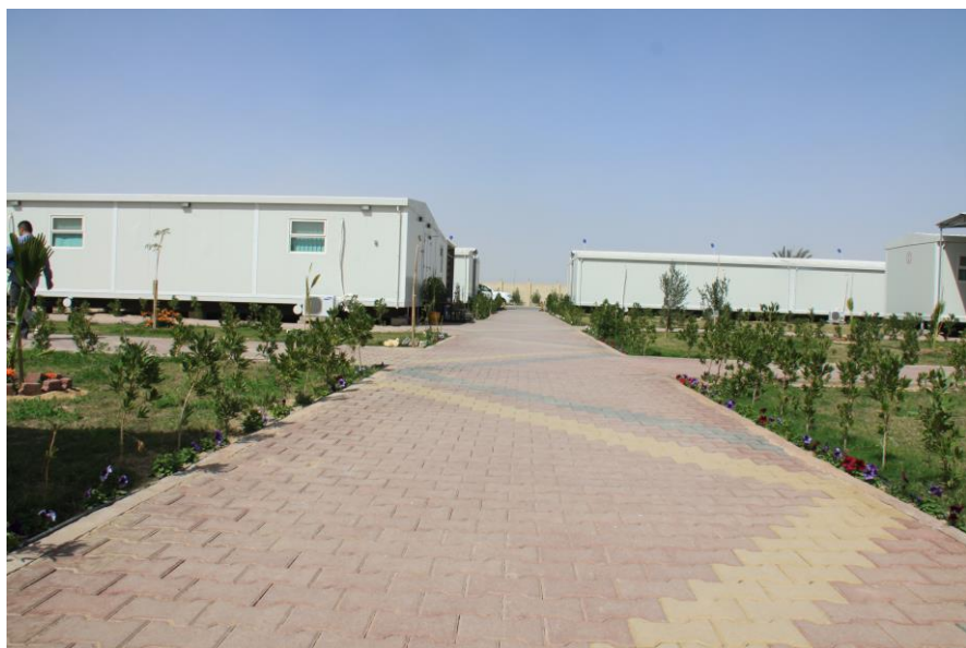
伊拉克沙漠中的中石油营地

【对伊投资】据中国商务部统计，2012年，中国对伊拉克直接投资1.48亿美元，截至2012年末，中国对伊拉克直接投资7.54亿美元。目前，进驻伊拉克的中资企业有中石油、中海油、绿洲公司、上海电气、苏州中材、中建材、葛洲坝、中电工、中地国际、中曼石油、中国机械设备工程股份有限公司、新疆贝肯、华为技术有限公司、中兴通讯股份有限公司、杭州三泰公司，大部分集中在伊拉克北部库尔德斯坦地区，以及瓦希特省、米桑省、巴士拉省等南部地区。