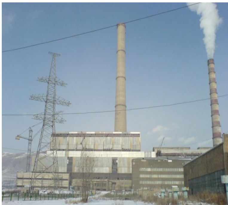
亚美尼亚拉兹丹电厂

中国黑龙江火电第三工程公司承包改造亚美尼亚拉兹丹电厂5号机组，该机组于2012年1月1日顺利竣工，并网发电。