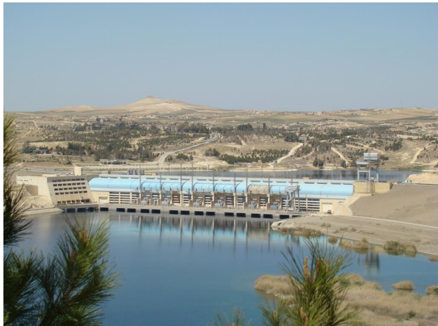
迪什林水电站发电机组—最大承包企业