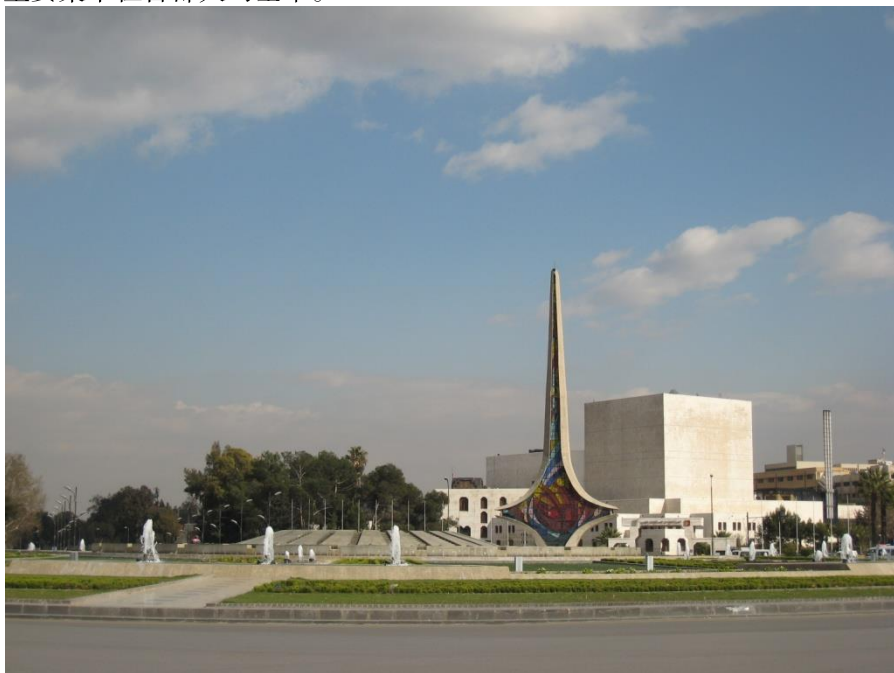
伍麦叶广场—叙利亚首都标志性建筑

叙利亚人口2220万（2011年），主要集中在大马士革、阿勒坡、霍姆斯、拉塔基亚、哈马、塔尔图斯等大城市。在叙利亚华人约25人左右，主要集中在首都大马士革。