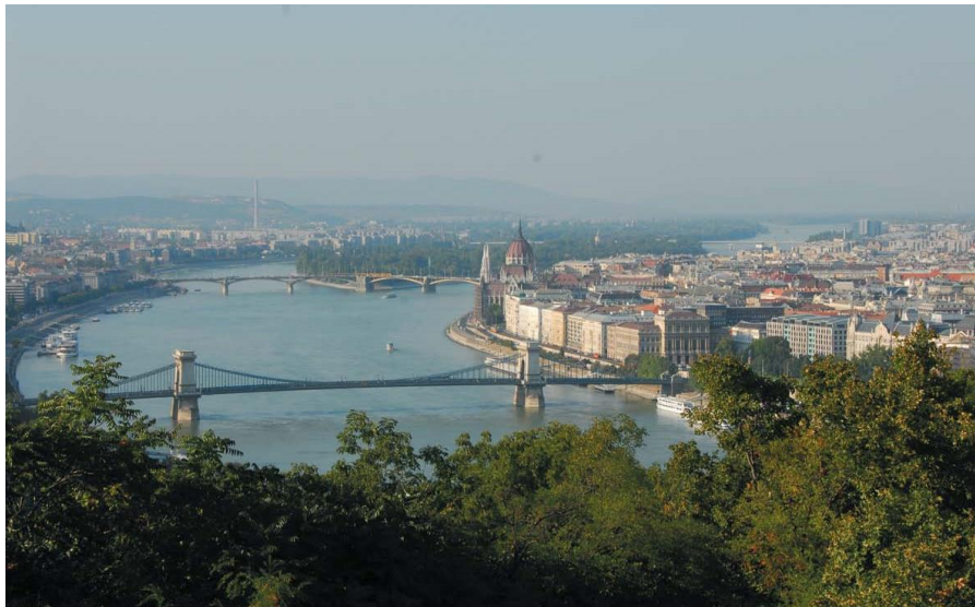
俯瞰布达佩斯多瑙河两岸

匈牙利旅游资源丰富，美丽的自然风光与壮丽古老的建筑交相辉映，全国有十处被联合国列入《世界文化与自然遗产名录》，另外还有9处国家公园。主要旅游景点有布达佩斯、巴拉顿湖、多瑙河湾和马特劳山等。首都布达佩斯坐落在多瑙河畔，是欧洲著名的古城，被誉为“多瑙河上的明珠”。独特的自然风光和人文景观使匈牙利成为旅游大国，也使旅游业成为匈牙利重要外汇来源之一。此外，匈牙利的葡萄酒以其历史悠久、酒味醇香而闻名于世。