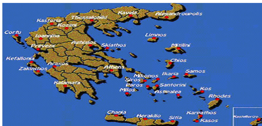
图2-2：希腊主要机场分布图