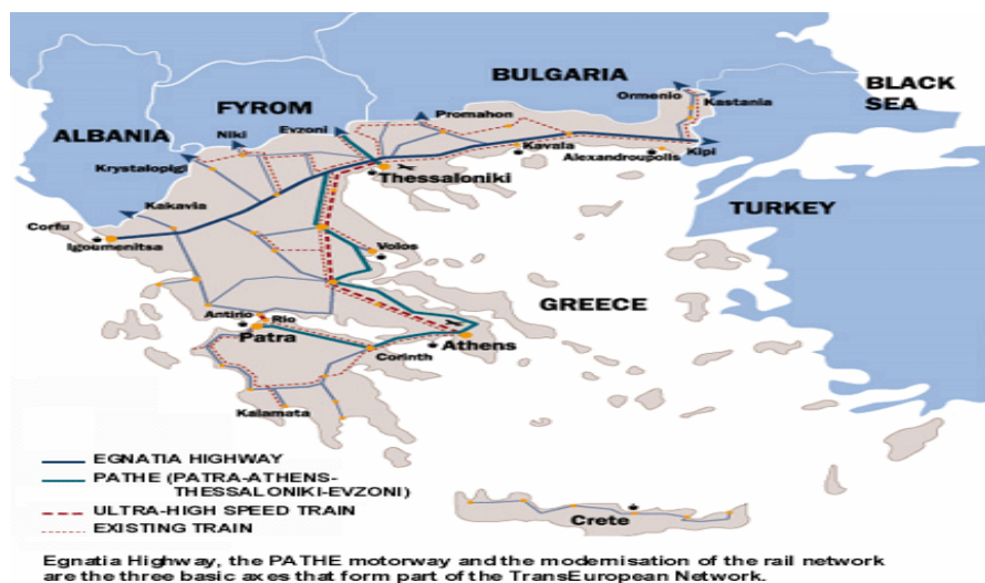
图2-1：希腊公路分布图

希腊铁路总长2571公里，其中标准轨1565公里、窄轨983公里、双重轨23公里，年货运量259万吨，年客运量888万人次。