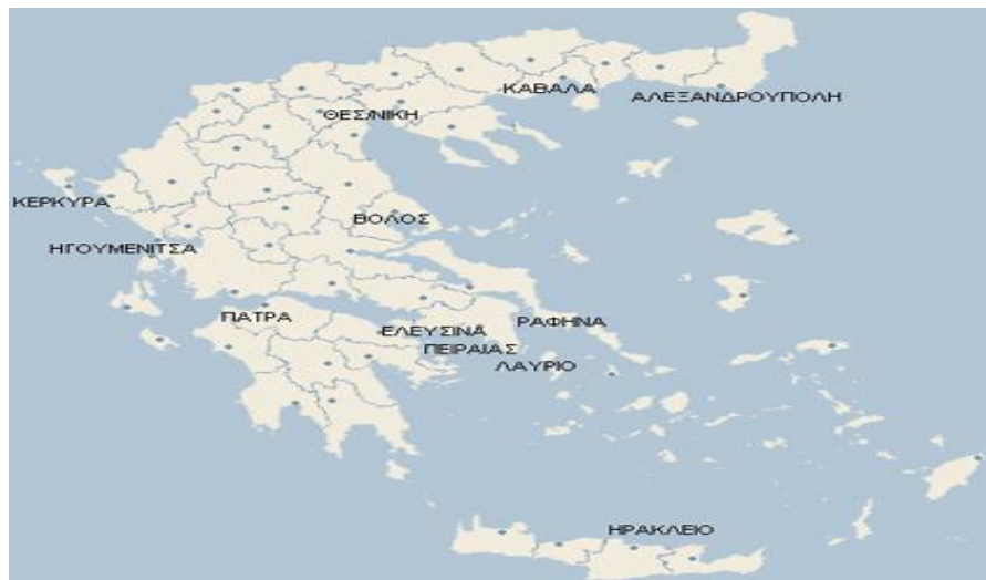
图2-3：希腊主要港口分布图

希腊是世界航运大国，拥有全球规模最大的商船队，运力约占世界总量的五分之一。截至2011年7月，希腊船东共有船只4714艘，其中3271艘船的载重量超过万吨，约占总载重力的98.5%。近年来，希腊船东致力于船队现代化建设，船舶质量明显改善，目前平均船龄仅为15.9年。希腊共有各类港口444个，主要港口有比雷埃夫斯、萨洛尼卡、沃洛斯和佩特雷等，总吞吐量约为8035万吨。希腊主要港口分布如图：