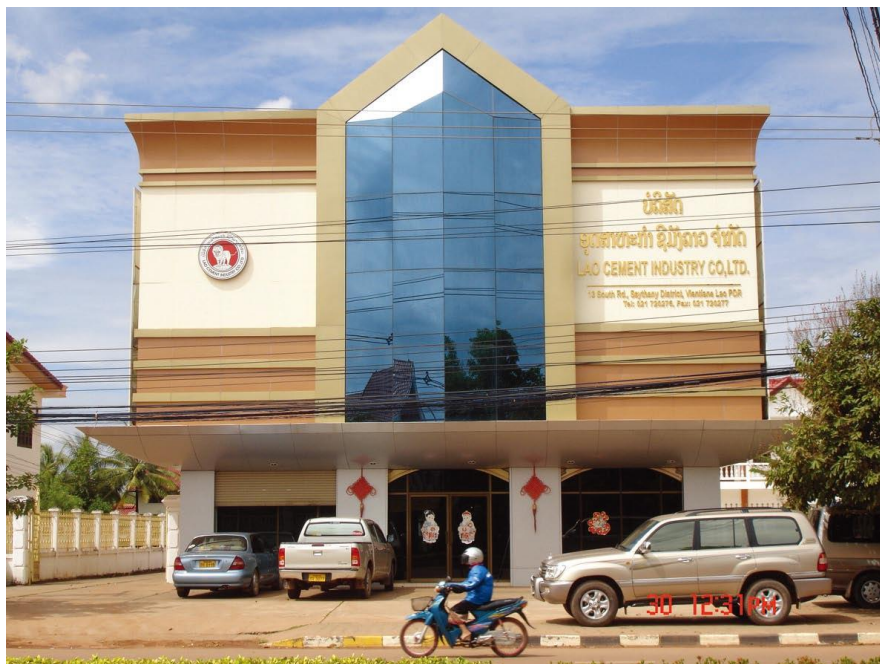
老挝水泥工业有限公司

【投资】据中国商务部统计，2012年当年中国对老挝直接投资流量8.09亿美元。截至2012年末，中国对老挝直接投资存量19.28亿美元。