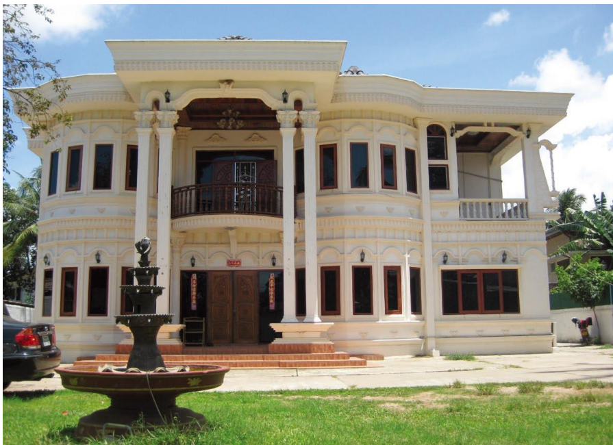
中水电老挝代表处及南俄5发电有限公司

老挝自1988年开放投资以来，项目投资的资金日益增长。据联合国贸发会议发布的2013年《世界投资报告》显示，2012年，老挝吸收外资流量为2.9亿美元；截至2012年底，老挝吸收外资存量为24.8亿美元。