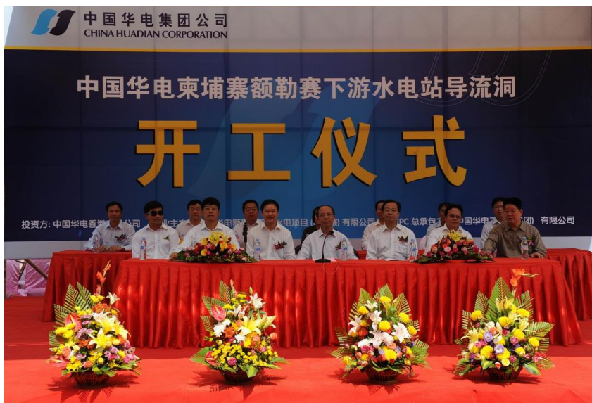
已开工的中国企业最大承包工程——柬埔寨额勒赛水电站项目

【双向投资】目前，柬埔寨企业基本没有对华投资。据中国商务部统计，2012年当年中国对柬埔寨直接投资流量5.60亿美元。截至2012年末，中国对柬埔寨直接投资存量23.18亿美元。投资产业主要分布在水电站、电网、通讯、服务业、纺织业、农业、烟草、医药、能源矿产、境外合作区等。主要中国企业有：中国华电集团公司、中国重型机械总公司、中国水电建设集团、中国电力技术进出口公司、中国大唐公司、中海油有限公司、神州石油有限公司、广西有色、广东外建、上海建工、云南建工、江苏红豆集团、柬埔寨光纤通信网络有限公司、华岳集团、华立生态、盾安有限公司、优联发展集团有限公司、宜佳旅游发展有限公司、申洲有限公司、欣兰制衣厂有限公司等。其中，江苏红豆集团在柬埔寨投资的“西哈努克港经济特区”是中国商务部首批境外经贸合作区之一。一期规划面积5.28平方公里，预计投资3.2亿美元。截至2013年3月，已有32家企业入驻。