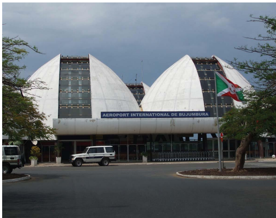
布隆迪布琼布拉国际机场

航空公司、乌干达航空公司和肯尼亚航空公司，埃塞俄比亚航空公司每天1班，比利时布鲁塞尔航空公司每周飞行3个航班，卢旺达航空公司每周飞行3个航班。