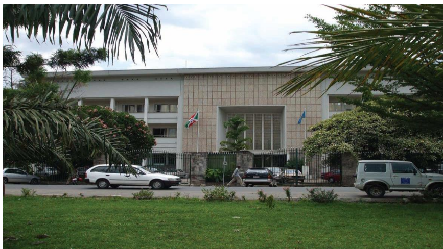
布隆迪共和国银行

目前当地的银行尚未建立和开通信用卡结算业务，在当地商业机构不可以用信用卡消费或提取现金。