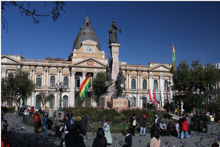
穆里略广场——总统府和议会所在地