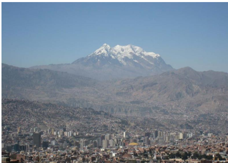
远眺坐落在山谷里的城市

【科恰班巴】全国第三大城市，科恰班巴省省会。位于玻利维亚中部河谷地区，系重要的交通枢纽。现有人口123.2万，海拔2558米。