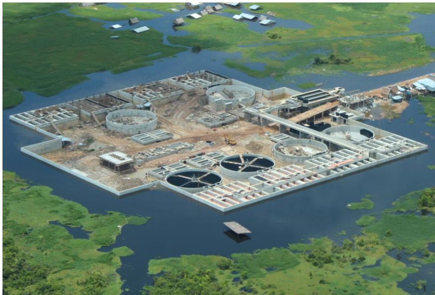
中水电对外公司正在实施的伊基托斯市水处理厂项目现场

【承包劳务】据中国商务部统计，2012年中国企业在秘鲁新签承包工程合同54份，新签合同额2.41亿美元，完成营业额3.50亿美元；当年派出各类劳务人员3644人，年末在秘鲁劳务人员3575人。新签大型工程承包项目包括华为技术有限公司承建秘鲁电信，上海振华重工（集团）股份有限公司承建ZP1933/4秘鲁callao码头项目，宁波东海集团有限公司承建秘鲁利马市政水表招标工程项目等。