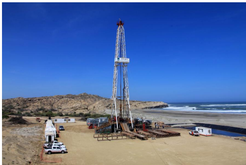
中石油秘鲁塔拉拉油田钻井

中国从秘鲁进口的主要产品有: 铜矿砂及其精矿、原油、鱼粉、铁矿砂及其精矿等; 中国向秘鲁出口的主要产品有: 计算机与通信技术、钢铁板材、手持无线电话机、摩托车等产品。