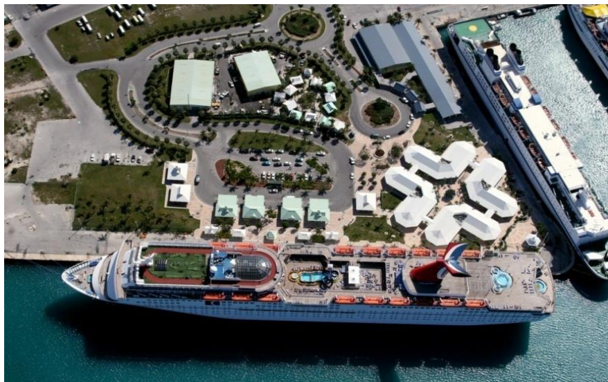
和记黄埔运营的大巴哈马岛邮轮码头

全国有大小港口（码头）51个，其中以拿骚港和弗里波特港的规模最大，拿骚港水深达16米，为天然良港。巴哈马自1976年开始对外开放船舶注册，为世界第三大船舶注册国。2008年拥有各类船舶1223艘，其中包括驳船3艘、散货船210艘、货船226艘、化工品货船88艘、矿石运输船12艘、集装箱船65艘、液化天然气运输船77艘、客轮109艘、客货两用船38艘、石油油轮209艘、冷藏货船119艘、滚装船16艘、车辆运输船51艘。