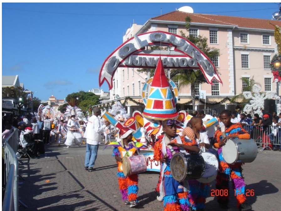
巴哈马最大的全民文化活动——詹卡努狂欢