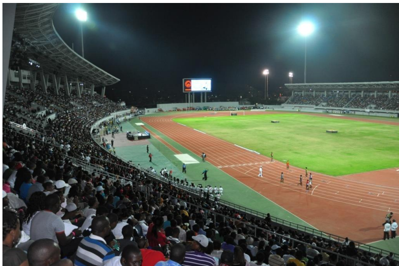
中国援建巴哈马国家体育场启用仪式于2012年2月25日隆重举行

【双边贸易】中巴贸易互补性较小，基本为中国出口。据中国海关统计数据，2012年中国与巴哈马双边贸易额为7.09亿美元，同比增长15.6%。其中，中国出口5.92亿美元，同比增长7.6%；中国进口1.17亿美元，同比增长85.8%。