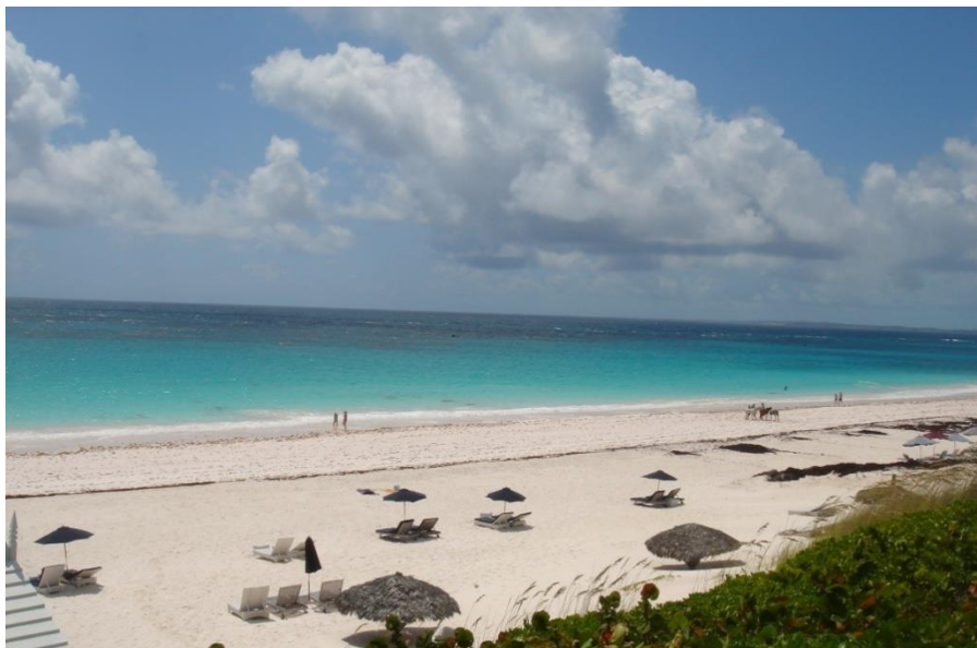
举世闻名的粉色沙滩

首都拿骚，人口24.9万（2010年）。位于巴哈马群岛中部的新普罗维登斯岛，是巴哈马的政治、经济和文化中心，也是世界著名的离岸金融中心，拥有约250家银行和金融机构。拿骚也是世界著名的旅游胜地，以阳光、海水、沙滩闻名于世。