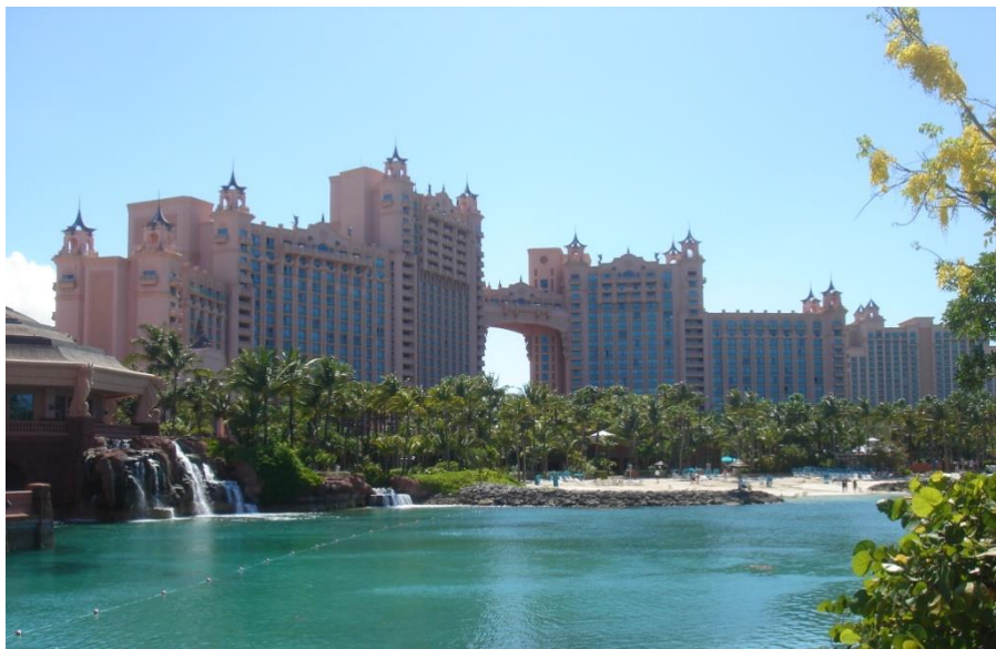
世界著名的天堂岛亚特兰蒂斯酒店