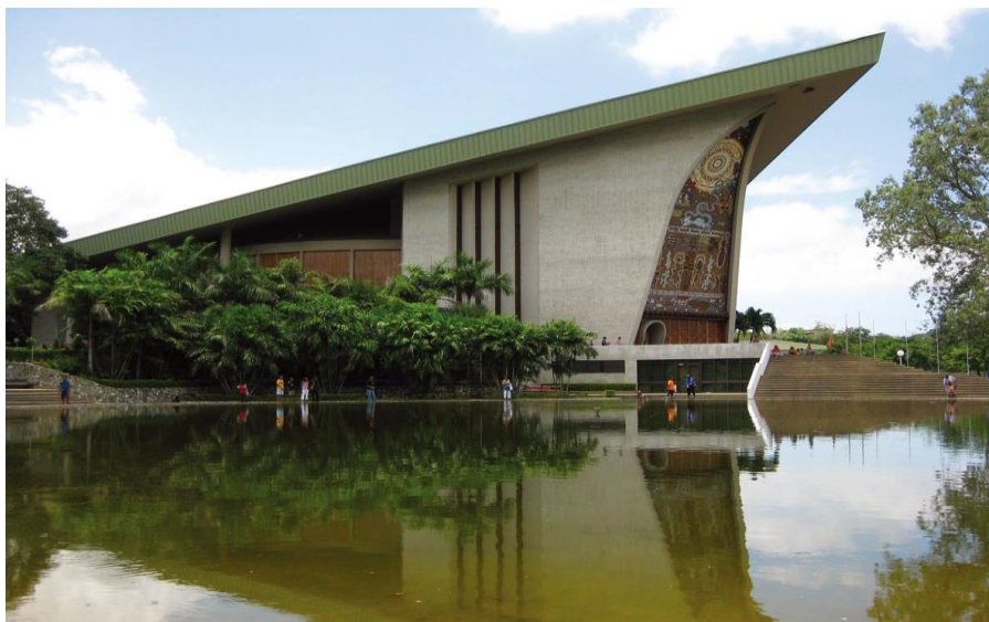
巴新标志性建筑——议会大厦

巴新军队创建于1940年，称巴新国防军，人数约2000人。巴新政府与澳大利亚签订了防务合作协议，澳每年提供约4000万澳元军援，并提供军事培训。