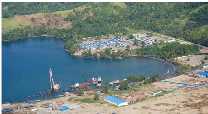
巴新最大的中资企业——瑞木镍钴管理（中冶）有限公司拉姆镍钴矿项目

据联合国贸发会议发布的2013年《世界投资报告》显示，2012年，巴布亚新几内亚吸收外资流量为0.3亿美元；截至2012年底，巴布亚新几内亚吸收外资存量为46.0亿美元。