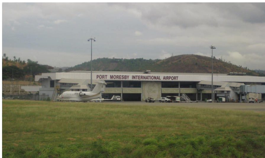
首都莫尔斯比港国际机场

中国去往巴新的主要航线需经香港、新加坡或悉尼转机。其中经香港转机的往返航班每周一次，经新加坡转机的航班每周四次。