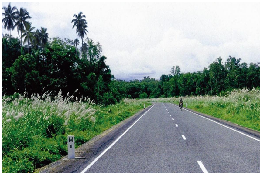
中国企业在巴新最大的承包项目之一——柏马公路

【重点项目】近年来,中资企业在巴新投资合作的主要项目包括:2006年11月3日,中国冶金集团与巴新方合作开发的拉姆镍矿项目奠基,2012年12月该项目正式投产,这是中国在太平洋岛国地区最大投资项目。2008年7月,首届巴新-中国贸易洽谈会在巴新首都莫尔斯比港举行。2009年12月,中国石油化工集团与巴新液化天然气项目牵头方埃克森美孚签署协议,中石化在项目投产后每年将获得200万吨液化天然气。