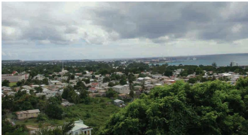
巴巴多斯港口远景

首都布里奇顿港是一个全天候、客货混用港。共有14个泊位，最大水深11.6米，港区货物装卸、运输、仓储设备齐全，年货物吞吐量约100万吨，接待游客约53万人次。除南加勒比海游轮线路外，暂无其他水上客运线路。