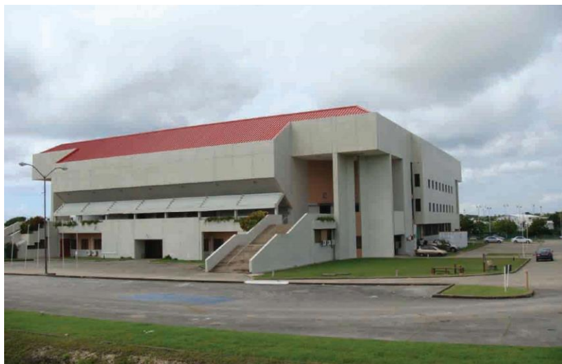
中国援建巴巴多斯的体育馆

据中国商务部统计，2012年中国企业在巴巴多斯新签承包工程合同1份，新签合同额125万美元，完成营业额278万美元；当年派出各类劳务人员2人，年末在巴巴多斯劳务人员42人。