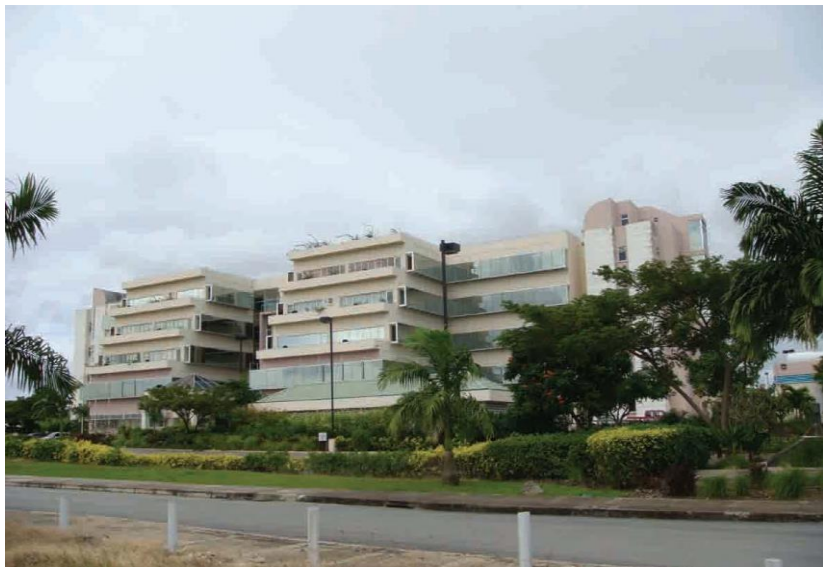
中建公司承包工程—巴巴多斯政府大楼