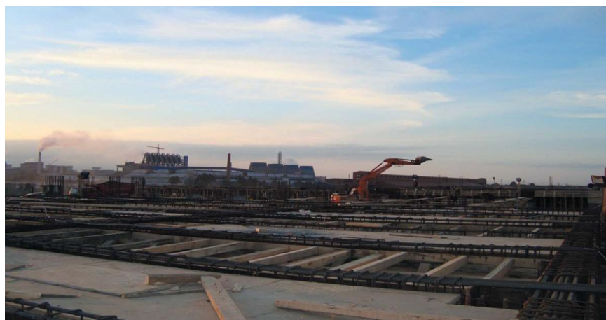
四川机械设备进出口公司承包项目——电解铝厂施工现场

【双向投资】根据中国商务部统计，截至2012年底，中国对阿塞拜疆累计直接投资3019万美元。目前，中国对阿投资主要集中在石油领域，中石油通过其海外公司与阿国家石油公司合作投资阿陆上油田“SALIYAN”，投资总额约2亿美元。该项目经过7年开发，目前收益较好，通过对石油开采项目的投资，带动了石油开采设备和服务的出口以及相关企业在阿的投资。此外，香港北方亨泰石油开发公司也在阿投资开采距巴库40公里处一个38平方公里的陆地油田“PIRSAAT”。