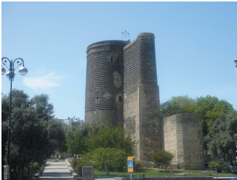
巴库最著名的古迹兼世界文化遗产——处女塔

惯相互亲吻面颊；较熟悉的同事或朋友见面和分别时，不论性别年龄，还会以相互贴面或亲吻脸颊的方式表示尊重和友情。鲜花是应邀正式做客或参加欢庆活动时送女主人的常见礼物。