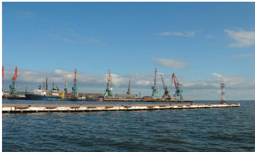
巴库港——里海最大港口

阿塞拜疆水运以里海货物运输为主，货运的六成以上为原油和成品油。巴库港是里海沿岸最大港口，不但可衔接里海水运与国内铁路运输，还可将里海水运与俄罗斯内河运输相联。巴库港与土库曼巴希港（土库曼