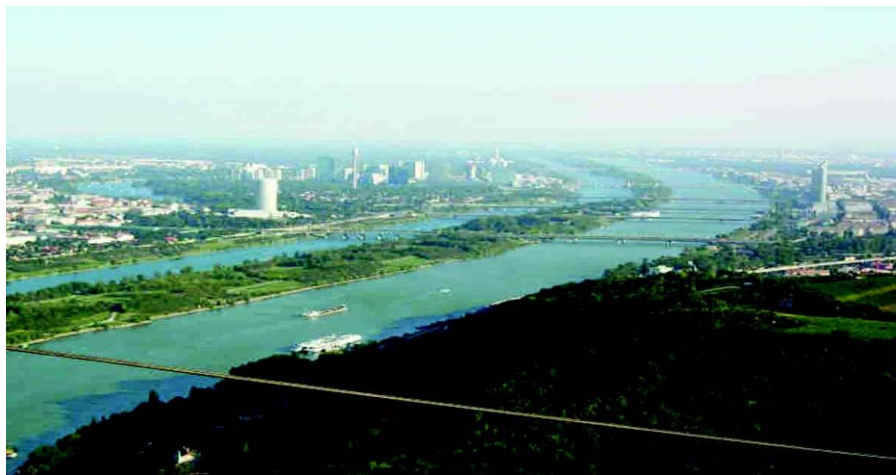
流经维也纳的多瑙河

奥地利矿产种类较多，主要有石墨、镁、褐煤、铁、石油、天然气等。森林、水力资源丰富，森林面积359.5万公顷，森林覆盖率43.4%。木材蓄积量10.9亿立方米。