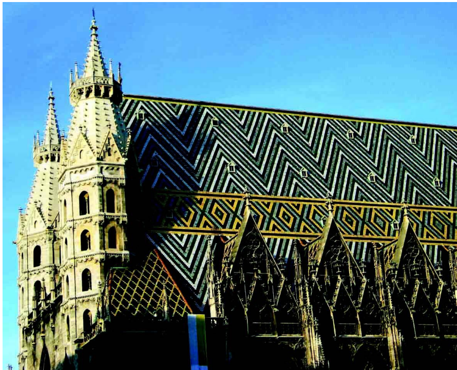
维也纳斯特凡大教堂

奥地利有74%的居民信奉罗马天主教，5%的居民信奉基督教。12%的居民不信教。其余居民中，穆斯林教徒有34万人，东正教信徒18万人，耶和华见证会教徒2万人，犹太教徒8100人。