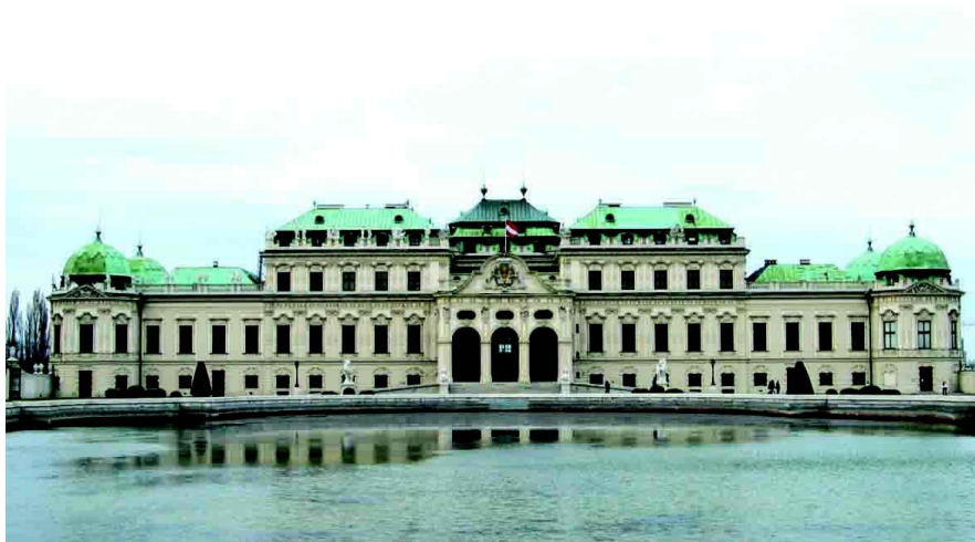
1955签订《国家条约》的欧根亲王府

公元996年，史书中第一次提及奥地利，当时巴奔堡王朝统治着这片区域。13世纪末，哈布斯堡王朝成为新的统治者，开始了长达600余年的哈布斯堡王朝历史。二元王朝-奥匈帝国是当时欧洲大地上强大的统治者。1914年奥地利王储在萨拉热窝遇害，成为第一次世界大战爆发的导火索，4年的战火给欧洲人民带来无穷灾难，也直接导致了奥匈帝国的解体和王朝的覆灭，民主制的奥地利共和国诞生。1938年3月奥地利被纳粹德国吞并，第二次世界大战中作为德国的一部分参战。1945年7月德国投降后，奥地利又被前苏联、美国、英国和法国占领，全境划分为4个占领区。1955年5月，4个占领国与奥地利签署尊重奥地利主权和独立的《国家条约》，当年10月占领军全部撤走，10月26日奥地利国民议会通过《永久中立法》，宣布不参加任何军事同盟，不允许在其领土上设立外国军事基地。