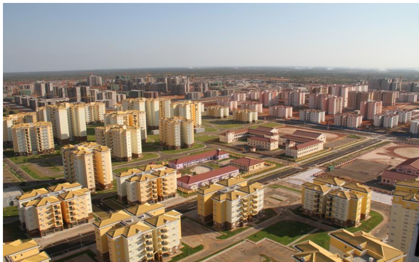
中信建设K.K.新城项目

在安哥拉设立的中资企业有56家。开展投资合作的主要企业有中水电、中工国际、国机集团、中兴通讯、中石化、中信建设等。其中，中石化与英国BP等石油公司合作，共同开发安哥拉第18区块等油气资源。