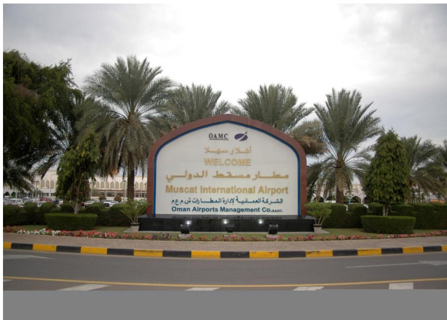
马斯喀特国际机场