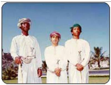
阿曼腰刀 阿曼人的正式着装

【服饰】阿曼男子虽与大多数阿拉伯人一样穿无领长袖大袍、戴头巾，但有明显的不同：一是袍子的领口外侧的下垂的花穗，可以注些香水；二是阿曼男子的头巾质地讲究，有很漂亮的花纹。在正式场合，男子一般习惯穿无领长袍，扎缠头巾，佩带弯刀（Khanjar），脚穿露出脚指头的皮凉鞋。妇女喜饰金银，服装艳丽，爱浓艳色彩。阿曼人能歌善舞，不过一般都是女歌男舞，男人在圈中欢快地跳舞，妇女则在外面以拍手唱歌伴舞。