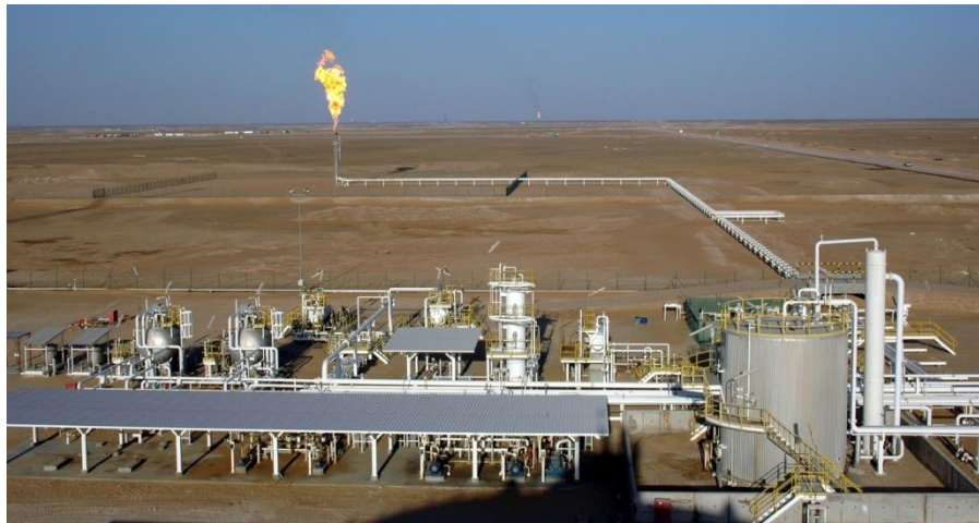
中石油阿曼5区块作业现场