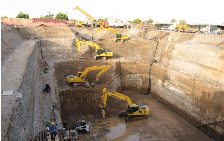
中水电公司阿曼污水管网工程中心泵站施工现场

【承包劳务】工程承包是中阿双边经济合作的主要形式之一，2007年10月，中国建材装备有限公司承揽了阿曼水泥厂日产4,000吨水泥生产线项目，合同额达1.62亿美元，已于2011年初建成投产；2009年，山东电力建设第三工程公司承建萨拉拉独立电厂项目，合同总额达7.1亿美元，为中国公司在阿承建的最大工程项目，已于2012年建成投产。此外，中国水利水电集团公司、中铁18局、长城钻井、中油物探、华为等企业也在阿曼取得了良好业绩。