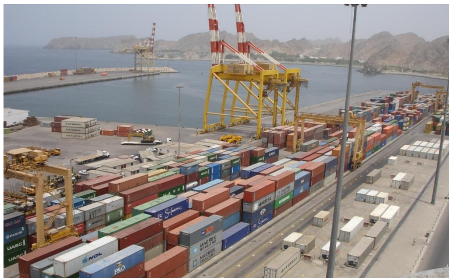
马斯喀特苏丹卡布斯港

【萨拉拉港】位于阿曼南部佐法尔省，距首府萨拉拉市15公里。港口由合资的萨拉拉港口服务公司负责开发运营，阿曼政府占股20%，马士基公司占股30%，退休基金和私人投资者占股29%。该港口于1998年建成投入营运，是一个多用途港口，可处理散货、集装箱和液体货物。港区面积10.71平方公里，其中水面部分5.95平方公里，陆地部分4.76平方公里；目前已建成19个泊位，分为两个部分：集装箱区共7个泊位，水深16-18米，总长度2,428米，可停靠世界上最大的集装箱船，年处理能力为600万标箱；普通货区共12个泊位，水深3-16米，总长度2,002米。