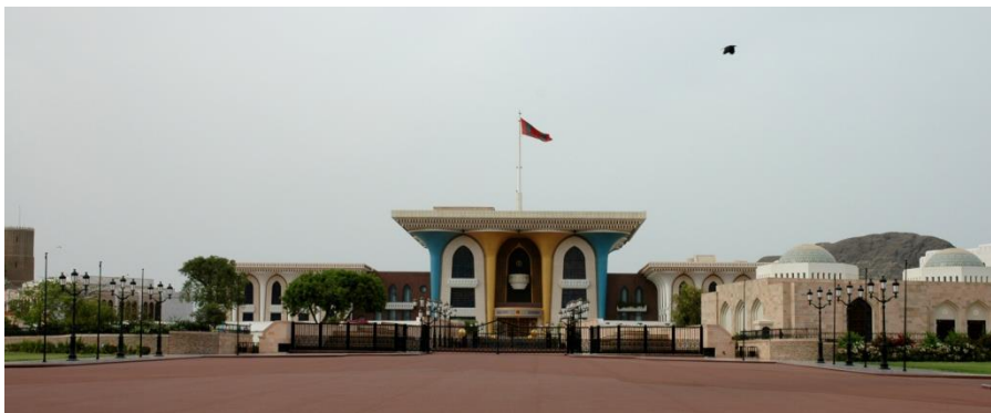
卡布斯苏丹行宫—旗帜宫

阿曼是阿拉伯半岛最古老的国家之一，公元前2000年已经广泛进行海上和陆路贸易活动，并成为阿拉伯半岛的造船中心。公元7世纪成为阿拉伯帝国的一部分。1507年葡萄牙入侵。1649年当地人推翻葡萄牙人统治，建立亚里巴王朝，其势力曾扩张到东非部分海岸和桑给巴尔岛。1742年波斯人侵入。18世纪中叶，阿拉伯人赶走波斯人，建立了赛义德王朝，使其成为印度洋上最强的国家之一。1871年英国入侵阿曼，迫使阿曼接受奴役性条约。20世纪初，山区部落起义，成立了阿曼伊斯兰教长国。1920年英国在马斯喀特同阿曼教长国签订了“西卜条约”，承认教长国独立，阿曼就此分为马斯喀特苏丹国和阿曼伊斯兰教长国两部分。1957年7月加利布教长领导的反英起义失败。1967年前苏丹泰穆尔统一阿曼全境，建立了马斯喀特和阿曼苏丹国。1970年7月23日泰穆尔苏丹被佐法尔省省长领导的一批人推翻，拥戴其子，29岁的合法继承人卡布斯·本·赛义德（Sultan Qaboos bin Said）接管政权，同年8月9日宣布国名为阿曼苏丹国。