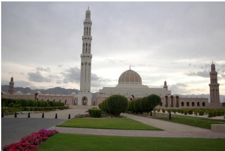
苏丹卡布斯大清真寺

【礼仪】阿曼人大多热情好客，遇到陌生人总是主动地打招呼，并热情问候。客人相见时，一般都要先互致问候，然后再行拥抱礼和亲吻礼。对女性一般不主动握手，也不能过分亲近和交谈，或拍摄女性照片。