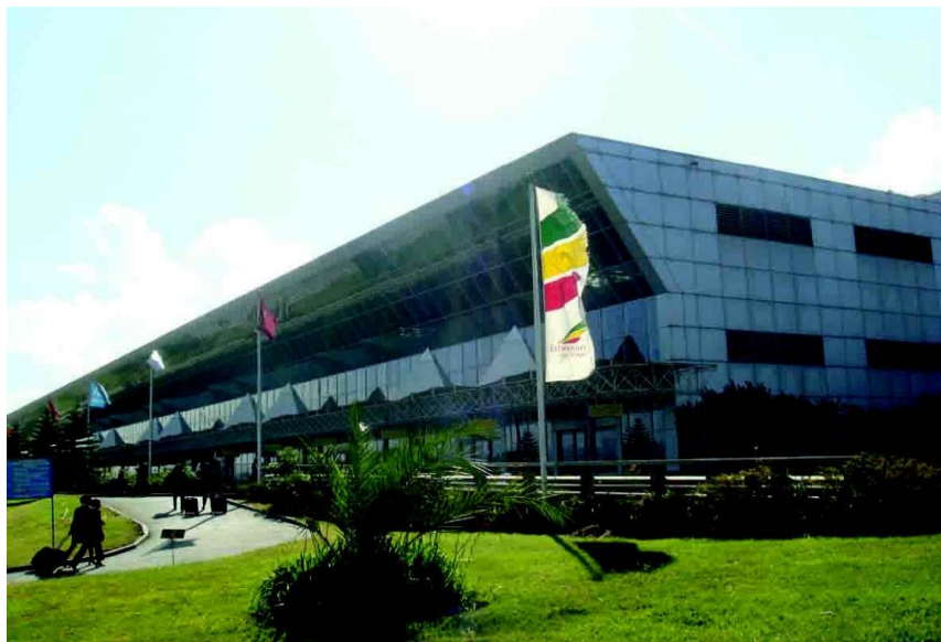
亚的斯博莱国际机场

中国至埃塞的航线主要由埃塞航空公司和阿联酋航空公司运营，其中，埃塞航空公司运营北京—亚的斯亚贝巴、广州—亚的斯亚贝巴、杭州—亚的斯亚贝巴和香港—亚的斯亚贝巴航线；阿联酋航空运营北京—亚的斯亚贝巴、上海—亚的斯亚贝巴和香港—亚的斯亚贝巴航线。