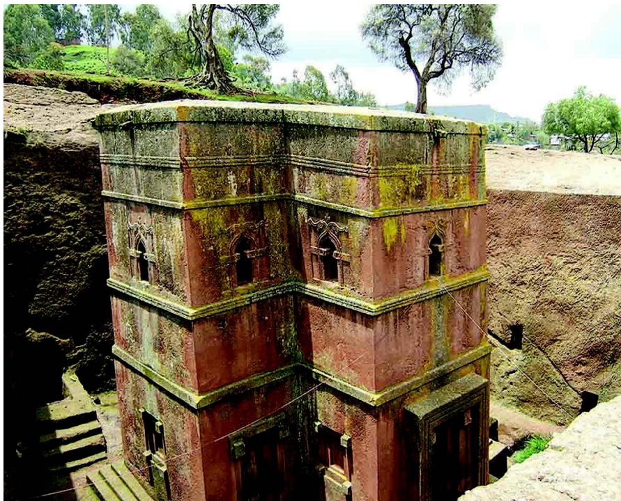
拉里贝拉岩石教堂

埃塞居民中45%信奉埃塞正教（即东正教），40-45%信奉伊斯兰教，5%信奉新教，其余信奉原始宗教。