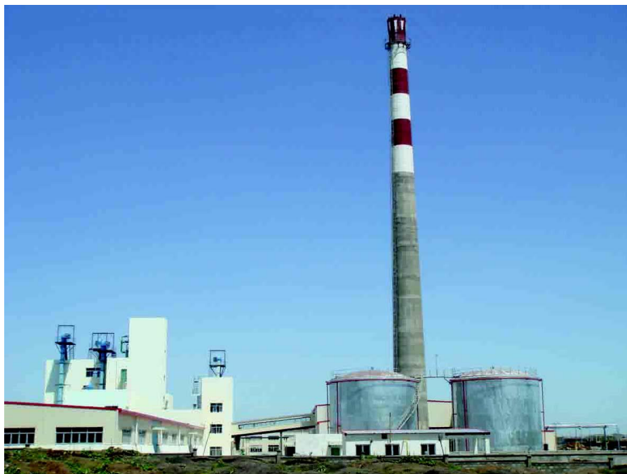
中非基金1号投资项目中地海外埃塞汉盛国际玻璃有限公司生产主线

【投资】中国在埃塞俄比亚投资规模快速增长，投资领域日趋多元化。据中国商务部统计，2012年当年中国对埃塞俄比亚直接投资流量1.22亿美元。截至2012年末，中国对埃塞俄比亚直接投资存量6.07亿美元。其中，规模较大的投资项目有：江苏永元投资有限公司投资的东方工业园、中地海外和中非基金联合投资的汉盛玻璃厂项目、中非基金和河南黑田明亮皮革制品有限公司联合投资的中非洋皮革厂、中非基金与江苏永元投资有限公司投资的东方水泥厂项目、华坚制鞋项目、力帆集团投资的扬帆汽车组装公司等。