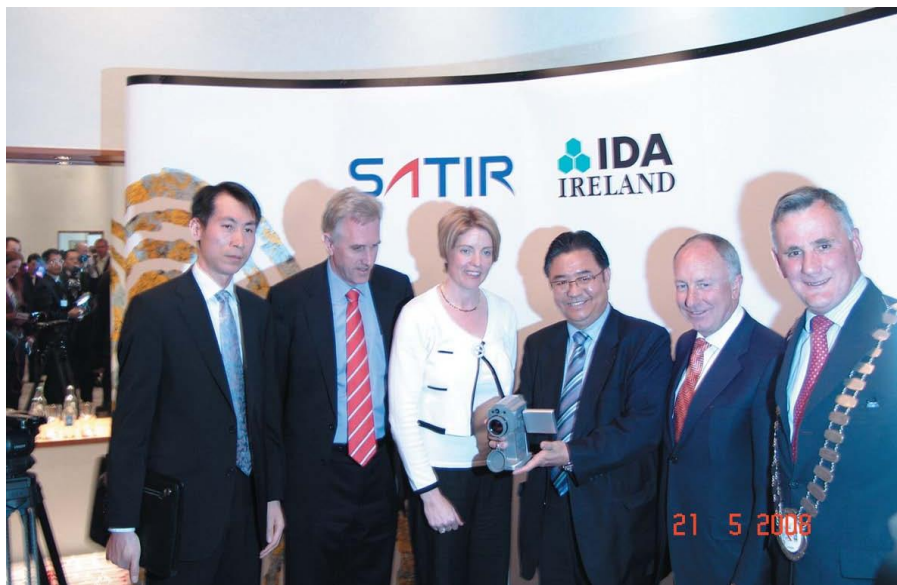
时任爱尔兰副总理出席中国飒特欧洲（爱尔兰）公司开业仪式