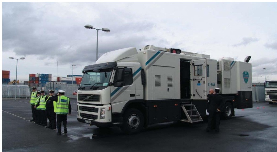
爱尔兰海关购买中国清华同方生产的一套集装箱检查系统

据中国海关统计，近年来，中国对爱尔兰出口商品主要类别包括①自动数据处理设备及部件；②医药品；③鞋类；④家具及其零件；⑤电话机；⑥新的充气橡胶轮胎；⑦纺织纱线、织物及制品；⑧塑料制品；⑨灯具、照明装置及类似品。