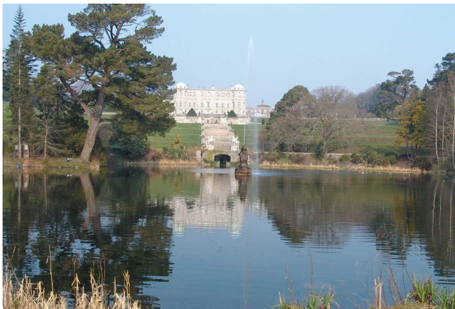
鲍威尔斯考特庄园

第二大城市科克是爱尔兰重要的经济和科研城市。主要工业为纺织、皮革、制造业及食品加工。科克港是世界上最大的天然港口之一，因此科克也是爱尔兰首屈一指的大型港口。