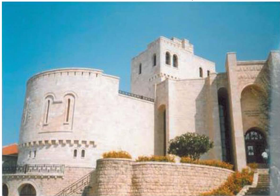
民族英雄斯坎德培纪念馆