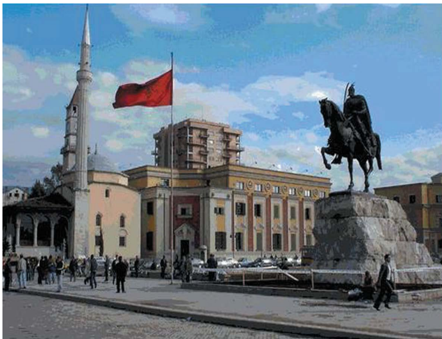
地拉那市中心广场

1912年11月28日阿尔巴尼亚宣布独立。第一次世界大战期间，阿尔巴尼亚被意、法和奥匈帝国割据。1920年阿再次宣告独立。1925年成立共和国，1928年改为君主制。第二次世界大战期间先后被意、德法西斯占领。1944年11月29日阿尔巴尼亚全国解放。1946年1月11日成立阿尔巴尼亚人民共和国。1976年改为阿尔巴尼亚社会主义人民共和国。1990年阿尔巴尼亚实行政治体制转轨，1991年4月改国名为阿尔巴尼亚共和国。根据1998年通过的宪法，阿尔巴尼亚为议会制共和国。2009年底欧盟批准了阿尔巴尼亚的入盟申请。