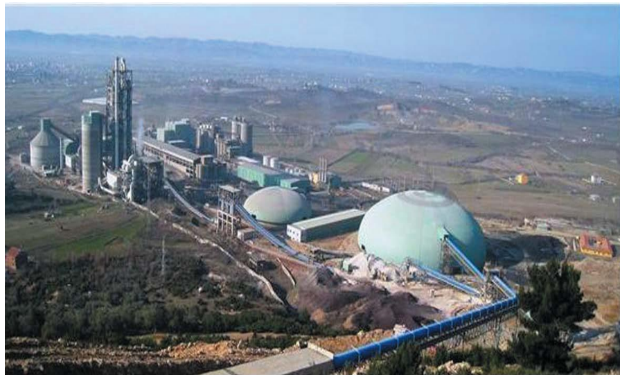
中材建项目：富舍—克鲁亚水泥厂

据中国海关统计，近年来，中国从阿尔巴尼亚进口商品主要类别包括①矿砂、矿渣及矿灰；②咖啡、茶、马黛茶及调味香料；③食用蔬菜、根及块茎；④铜及其制品；⑤塑料及其制品；⑥电机、电气、音像设备及其零附件；⑦车辆及其零附件，但铁道车辆除外；⑧机械器具及零件；⑨木浆等纤维状纤维素浆；废纸及纸板；⑩铝及其制品。