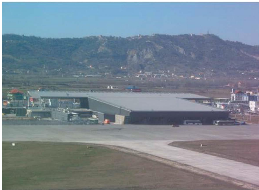
里纳斯国际机场（又称特蕾萨修女机场）